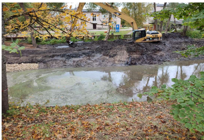
Valymo darbai Tīrīšanas darbi