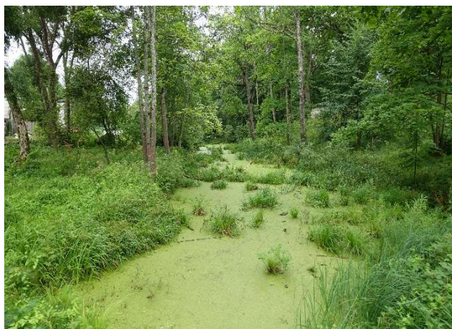
Kanālas prie valymą Kanāls pirms tīrīšanas